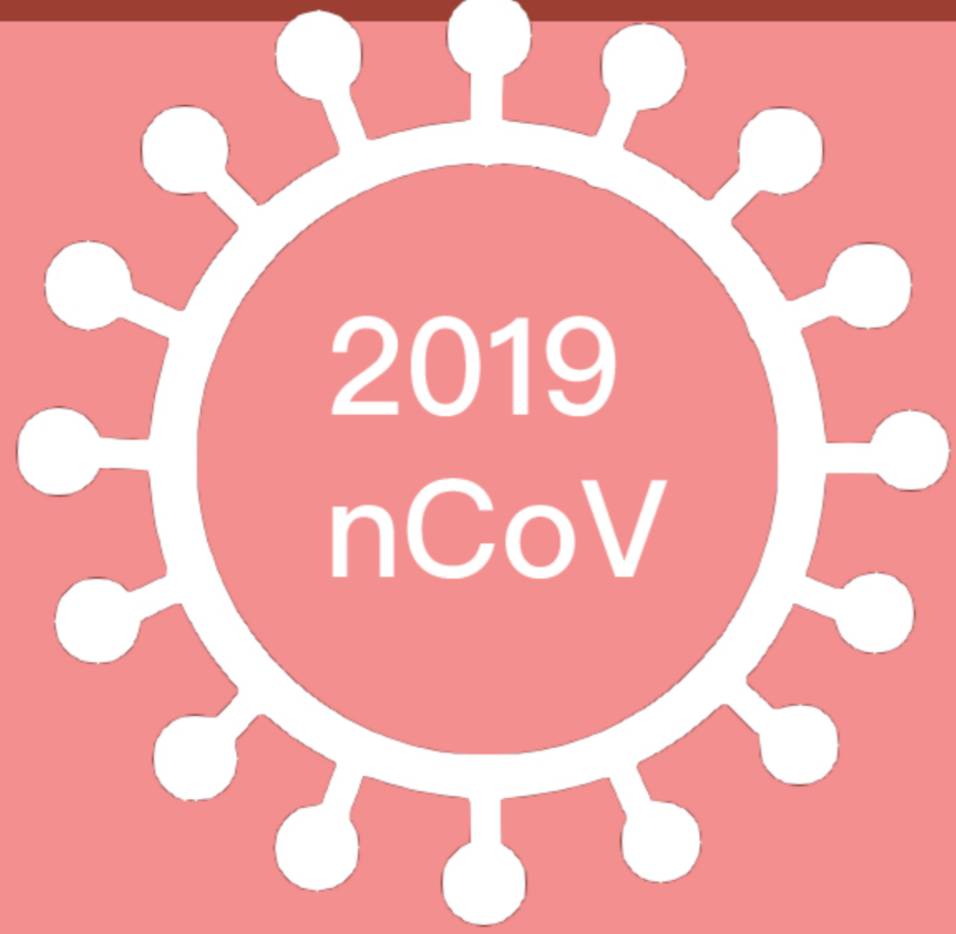
2019 nCoV 新型冠狀病毒