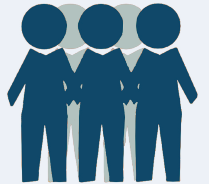
減少進出 公眾場所